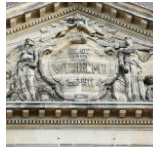
Am Palast der Bezirksregierung