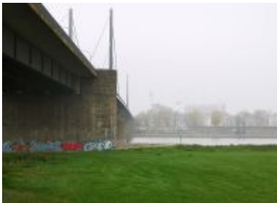
Theodor-Heuss-Brücke im Herbst