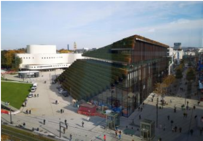
Nochmal: Kö-Bogen II von oben