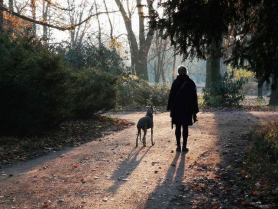
Frau mit Hund morgens im Volksgarten