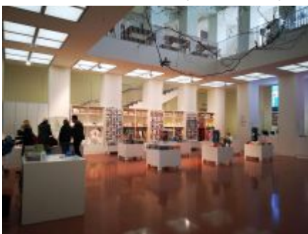
Museumsshop im Kunstpalast