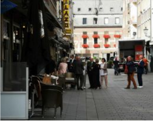
Vormittags auf der Bolkerstraße