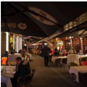
In der Schneider-Wibbel-Gasse am Abend