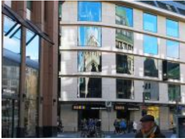
Spiegelung an der Meyer'schen