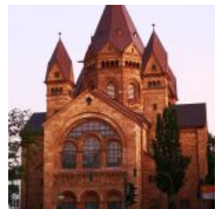
Kreuzkirche in der Abendsonne