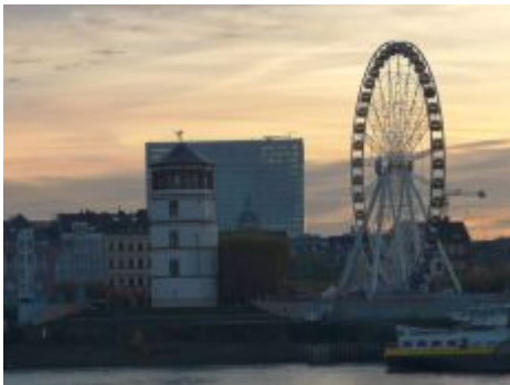
Morgen auf der anderen Seite