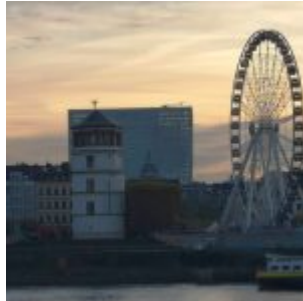
Morgen auf der anderen Seite