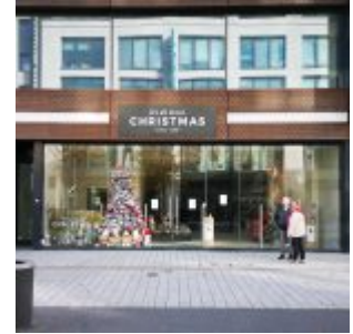
Weihnachtsladen auf der Schadowstraße

Im Instagram-Stream von The Düsseldorf veröffentlichen wir jeden Tag ein Bild aus Düsseldorf. Und weil so viele Leserinnen und Leser diese Fotos mögen, sammeln wir die Bilder eines Monats und präsentieren sie noch einmal hier als Album. Dies sind die Bilder aus dem November 2021.