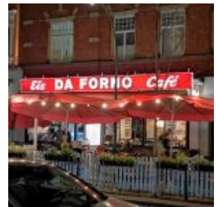
Eiscafé Da Forno, Schwerinstraße