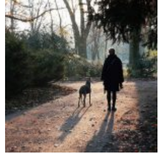
Frau mit Hund morgens im Volksgarten