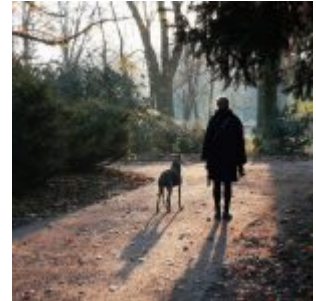
Frau mit Hund morgens im Volksgarten