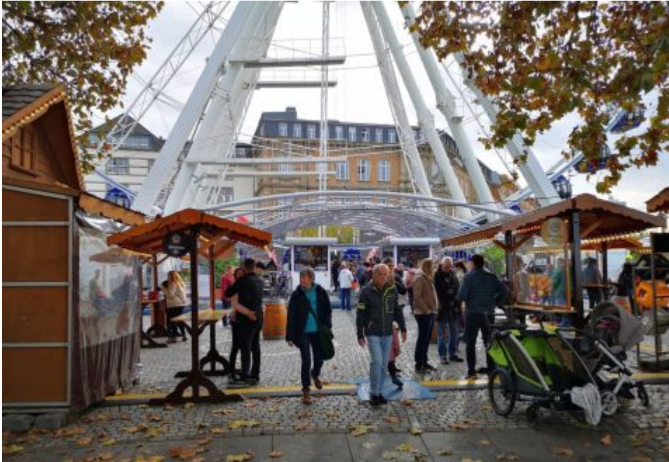
Am Riesenrad auf dem Burgplatz