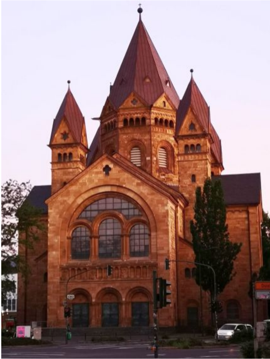
Kreuzkirche in der Abendsonne