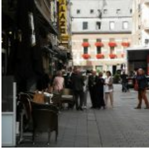
Vormittags auf der Bolkerstraße