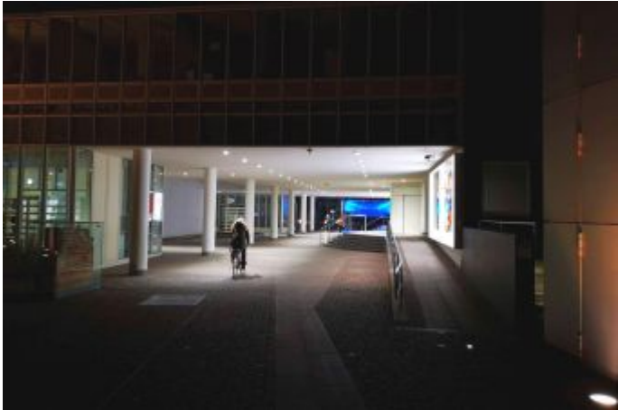
Passage am K20