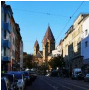
Blücherstraße, Blick in Richtung Kreuzkirche