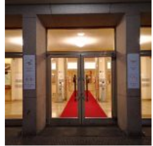
Eingang zum „alten“ Opernhaus