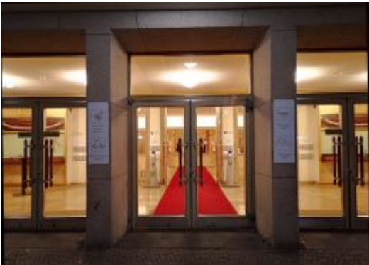
Eingang zum „alten“ Opernhaus