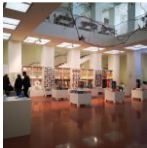
Museumsshop im Kunstpalast