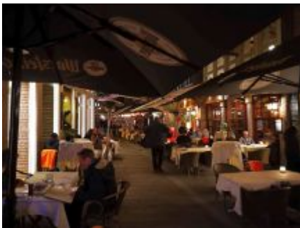
In der Schneider-Wibbel-Gasse am Abend