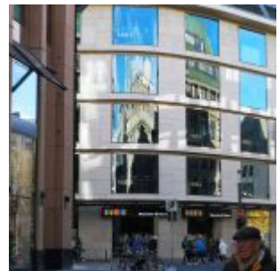
Spiegelung an der Meyer'schen