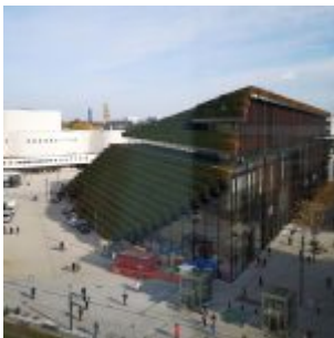
Nochmal: Kö-Bogen II von oben