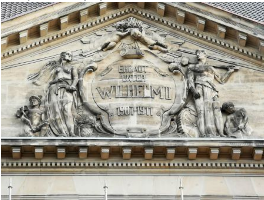
Am Palast der Bezirksregierung