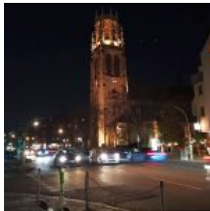
Herz-Jesu-Kirche an der Roßstraße