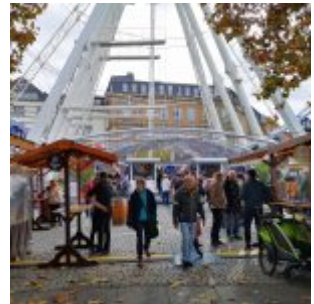
Am Riesenrad auf dem Burgplatz