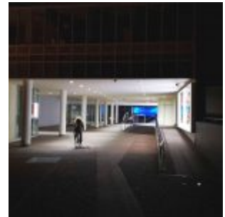
Passage am K20