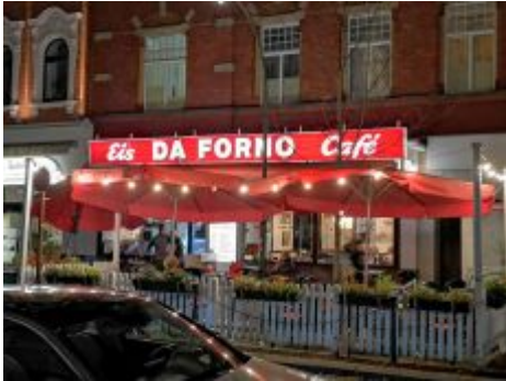
Eiscafé Da Forno, Schwerinstraße