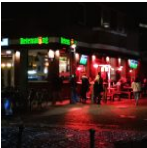
Retematäng an einem Mittwochabend