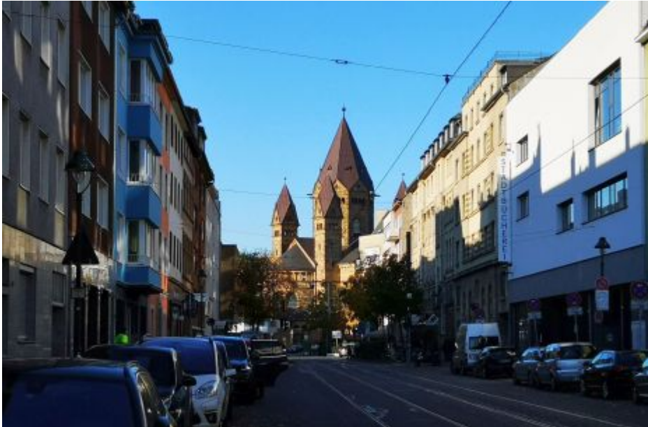
Blücherstraße, Blick in Richtung Kreuzkirche