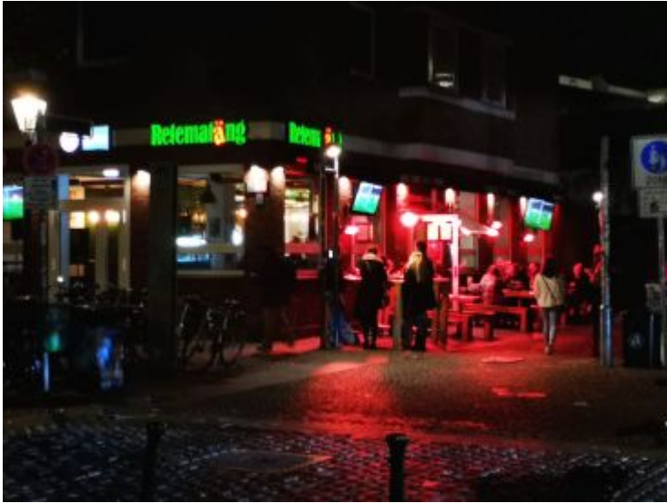
Retematäng an einem Mittwochabend