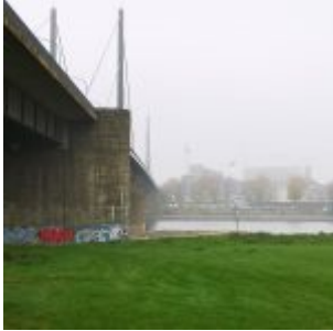
Theodor-Heuss-Brücke im Herbst