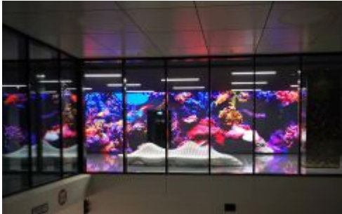
Virtuelles Aquarium im Fortytour an der Rolandstraße