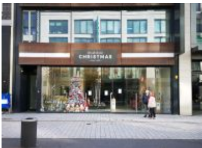
Weihnachtsladen auf der Schadowstraße

Im Instagram-Stream von The Düsseldorf veröffentlichten wir jeden Tag ein Bild aus