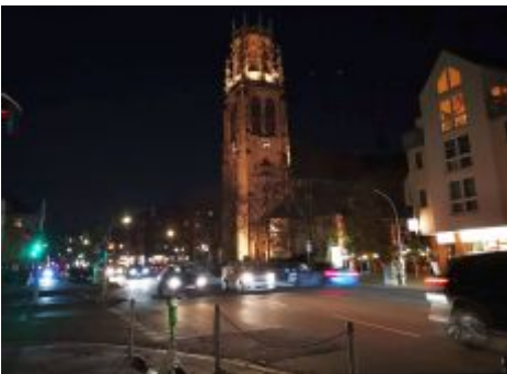
Herz-Jesu-Kirche an der Roßstraße