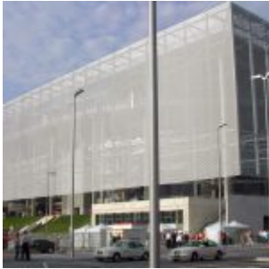
Die Außenhaut noch ohne Logo