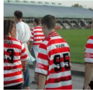
Schöne alte Trikots