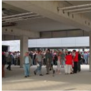
Der provisorische Eingangsbereich