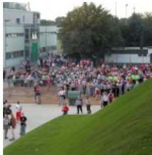
Die Massen kommen