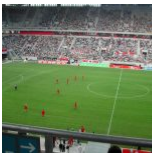
Weit weg von den Spielern