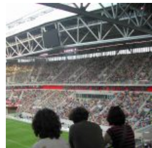
Blick auf die Süd beim Pre-Opening der Arena 2004