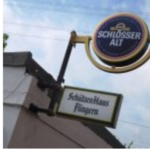
Früher Sportplatz, jetzt Schützenhaus