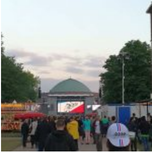
Kraftwerk im Ehrenhof 2017