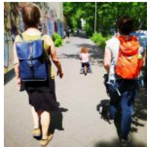
Oma, Mutter, Kind auf der Ringelsweide