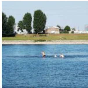
2020: Schwimmer im Rhein bei Neuss bringen sich in Lebensgefahr