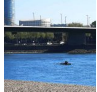
Ruderer vor der Altstadt