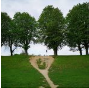
Aufstieg am Deich