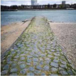
Damm für ein Abflussrohr (Niederkassel)