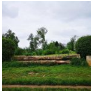
Oxer auf der Löricker Rheinwiese