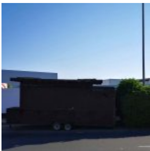
Imbisswagen im Hafen