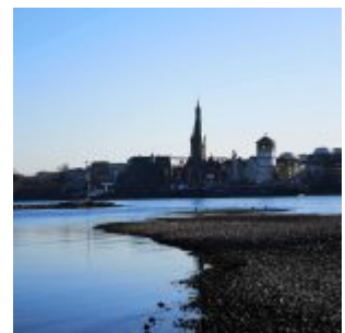
Blick rüber in die Altstadt