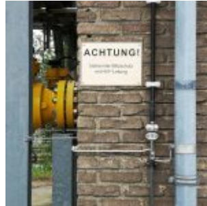
Achtung im Hafen