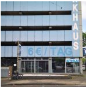
Parkhaus Karl-/ Ecke Grupellostraße