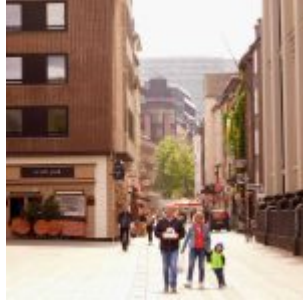
Blick in die Hunsrückstraße