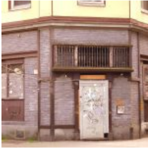
Die Zwiebel, geschlossen