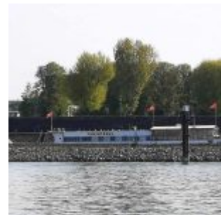
Die Rheintreue aus der Ferne