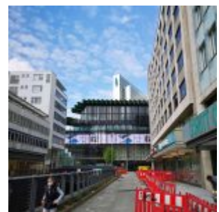
Blick zum Kö-Bogen II