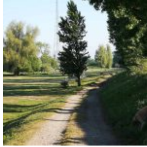
Weg auf der Lausward