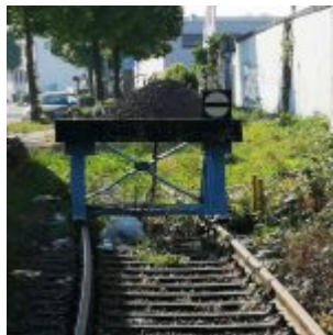
Prellbock im Hafen