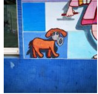
Zeitgemäßes Mural an der Corneliusstraße