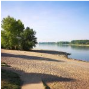
Rheinstrand bei Lörick