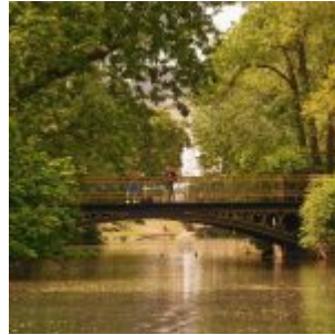
Bilder aus dem Mai 2020: Die goldene Brücke im Hofgarten

[Anklicken zum Vergrößern] Auf der Facebook-Seite von The Düsseldorfer veröffentlichen wir jeden Tag ein Bild aus Düsseldorf. Und weil so viele Leserinnen und Leser diese Fotos mögen, sammeln wir die Bilder eines Monats und veröffentlichen sie noch einmal hier als Album. Dies sind die Bilder aus dem Mai 2020.