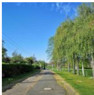
Weg zum Inigolf-Platz bei Niederkassel