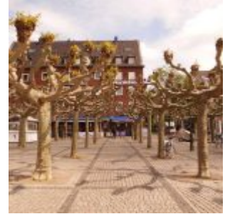
Burgplatz am Schwan