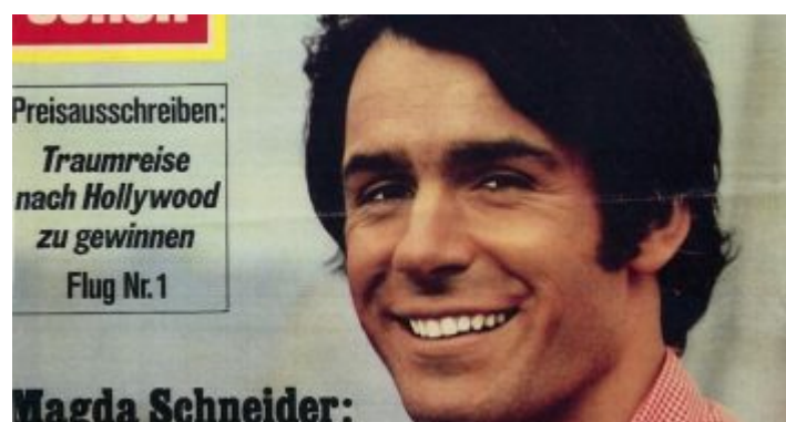
TV Hören + Sehen anno 1969

[Lesestück] Als Schüler in den Sechzigerjahren hatte man viele Möglichkeiten, in den Schulferien Geld zu verdienen. Zwischen 1968 und dem Beginn des Studiums an der Kunstakademie hatte ich tolle Ferienjobs: bei einem Schreiner, im Drahtlager der Klöcknerwerke, als Laufbursche bei einem obskuren Import-/Export-Laden, als Nachtwächter in der alten Messe und sogar beim Friedhofsgärtner. Schwieriger war es schon, eine regelmäßige, dauerhafte Tätigkeit für nachmittags zu bekommen, um das Taschengeld aufzubessern. Und obwohl es wirklich nicht viel zu verdienen gab – dazu später mehr – trug ich zwischen 1969 und 1972 Zeitschriften aus dem Heinrich-Bauer-Verlag im Zooviertel aus. Die Runde war spannend, und es gab bei einigen Abonnenten sogar gutes Trinkgeld.