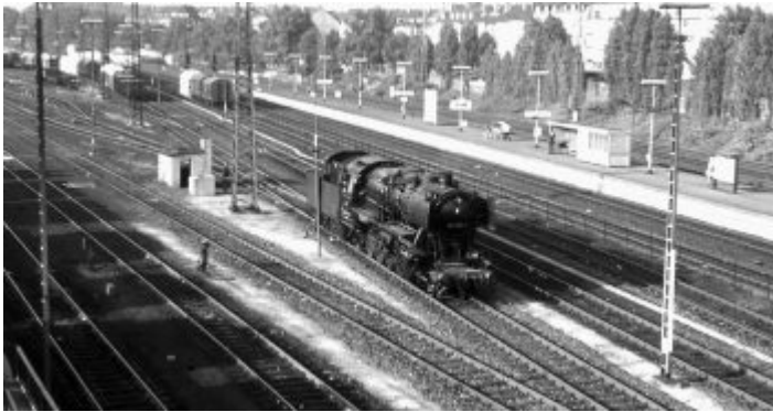
1973 arbeiteten noch Dampfloks auf dem Derendorfer Rangierbahnhof

Donnerstags brachte eine Spedition die in Folie eingeschweißten Pakete mit den Zeitschriften. Man warf die in den Hausflur und klingelte, und ich musste rasch nach unten sausen, damit die wertvollen Magazine nicht geklaut wurden (was aber zwei-, dreimal doch geschah). Einmal im Monat musste ich zum Rapport und zur Abrechnung im Büro – zuerst auf der Grabenstraße in der Altstadt, später auf der Geistenstraße in Derendorf – antanzen. War die Zahl der Remittenden zu groß, wurde ich vom zuständigen Sachbearbeiter angebrüllt. Ab einer bestimmten Quote gab es Abzug bei meiner Provision. Apropos: Schaffte ich es, einer existierenden Abonnettin (mehr als drei Viertel meiner Kundschaft waren Damen...) eine weitere Zeitschrift anzudrehen oder ihr Abo vorzeitig zu verlängern, bekam ich eine lohnenswerte Provision in Höhe des Preise für den Bezug eines Monats.