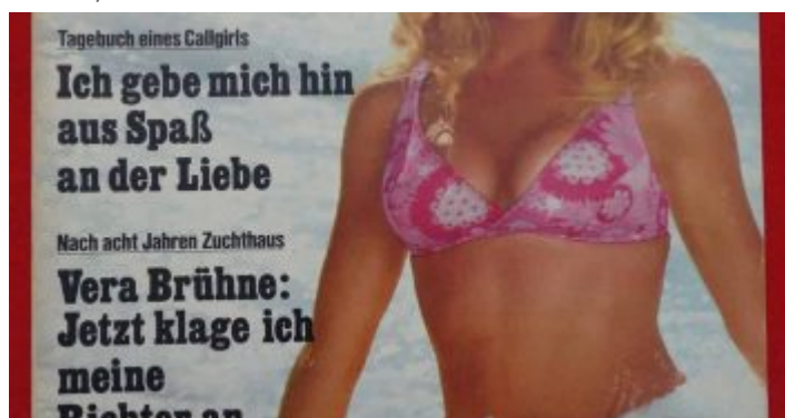
Sex sells – Neue Revue im Jahr 1970

die Mappen herunternehmen und im jeweiligen Hausflur deponieren. Wir wohnten damals auf der Lennéstraße an der Ecke zur Tussmannstraße. Also schob ich das Rad bergan zur alten Zoobrücke, die über die Gleise des Rangierbahnhofs Derendorf und die Schienen von S-Bahn und Fernverkehr führte. Es handelte sich um eine nach dem Krieg schnell errichtete Überführung mit je einer Fahrbahn in jeder Richtung und den Straßenbahnschienen der Linie 6 in der Mitte. Die eine Runde begann dann an der Ecke der Rethelstraße zur Achenbachstraße. Auf dieser Straße bis zum Brehmplatz gab es in jedem zweiten Haus eine Kundin. Dann musste ich einen Abstecher zum Hochhaus am Zoopark machen. Weiter ging's die Lindemannstraße bis zur Goethestraße und dann quer durchs Viertel bis zum Schillerplatz. Später ging ich diese Tour in umgekehrter Reihenfolge, weil ich so Gelegenheit hatte, einen Teil des verdienten Geldes auf der Rethelstraße auszugeben.