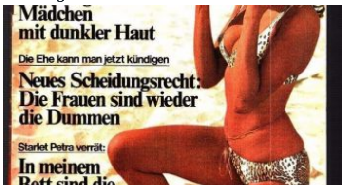
Noch nicht sehr schmuddelig – Die Praline von 1970