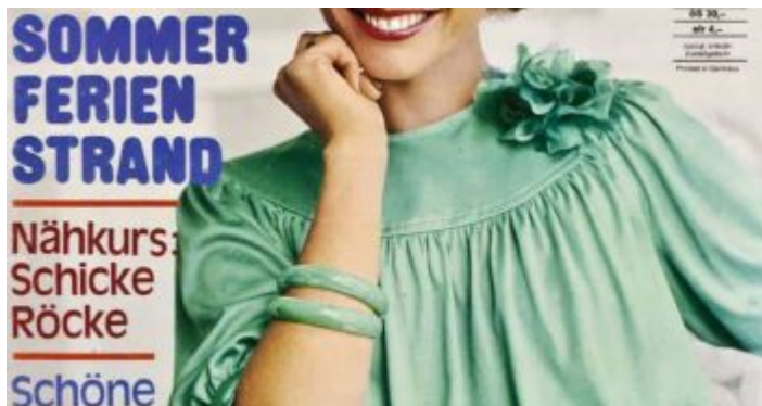
Neue Mode, die Zeitschrift für die alleinstehende Dame (hier von 1975)

Es gab eine ganze Reihe alter, alleinstehender Frauen, denen es finanziell nicht so gut ging und denen gewissenlose Vertreter die Zeitschriften aufgeschwatzt hatten. Manche von denen öffneten oft gar nicht, wenn ich klingelte, oder hatten gerade kein Geld im Haus. Meistens stundete ich den Betrag und bekam dann das Geld für den ganzen Monat, wenn die Rente eingetroffen war. Bei einigen schellte ich irgendwann gar nicht mehr, weil sie mir so leidtaten, und vermerkte durchgehend, sie nicht angetroffen zu haben. Eine Dame mittleren Alters, eine wirklich attraktive Frau, die im Hochhaus am Zoo wohnte, begann irgendwann, mir Avancen zu machen und empfing mich auch schon einmal im wehenden Bademantel mit wenig darunter – sie war Neue-Mode-Abonnentin. Die meisten Bezieherinnen waren kurz angebunden oder sogar unfreundlich – vermutlich, weil sie das vermaledeite Abo gar nicht mehr haben wollten.