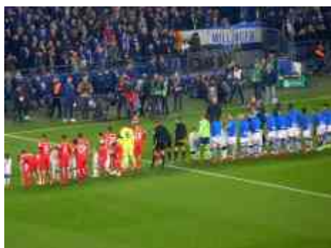
Vor dem Testspiel gegen S04