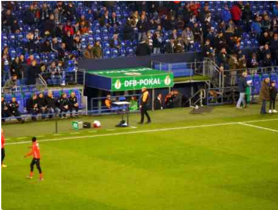
Der Pokal hat...