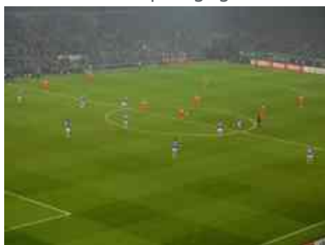
Anstoss nach dem 1:0