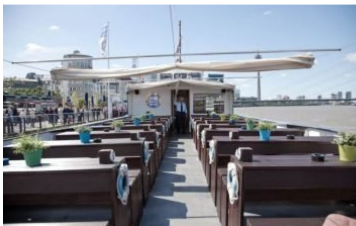
Das Freideck der MS Düssel

Wie die kleine Schwester MS Düsselschlösschen stammt auch die MS Düssel aus dem Jahr 1962 und war eines der in Düsseldorf legendären Rheinbahnböötchen. 1896 gründete eine Gemeinschaft hiesiger Kaufleute die Rheinbahn, damals übrigens vor allem dazu, die linksrheinischen Gebiete zu entwickeln; da kam eine Verkehrsgesellschaft als Mittel zum Zweck gerade recht. Schon 1898 setzten die Verantwortlichen aber auch für Personenschiffahrt, und über fast 100 Jahre betrieb die Rheinbahn ein Flotte für den Fähr- und Linienverkehr. Und weil dieser Geschäftszweig nicht profitabel war, trennte sich die Gesellschaft 1993 von der Flotte. Mit dem Kauf der Schiffe MS Stadt Düsseldorf , MS Erft , MS Kaiserswerth und MS Düssel durch die Ingenieurs- und Kaufmannsfamilie Küffer begann das neue Zeitalter der Weissen Flotte.