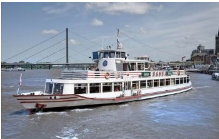
Die MS Düssel zeigt ihre Schokoladenseite

Auf dem zweiten Freideck im Bug können weitere rund 25 Gäste mit Blick nach vorne nachvollziehen, was der Käpt'n sieht, der in seinem Fahrstand hinter und über ihnen thront. Im Salon unter Deck gibt es Sitzgelegenheiten für knapp 100 Menschen. Hier findet sich die Bar und eine kleine Küche, von der aus die Gäste mit Speis und Trank versorgt werden können. Theoretisch könnten also fast 250 Personen an Bord der MS Düssel auf dem Rhein cruisen. Tatsächlich wird das Schiff im Charterbetrieb für maximal 120 Gäste empfohlen – so finden alle auf jeden Fall auf den Freidecks einen Platz, können es sich aber auch im Salon bequem machen.