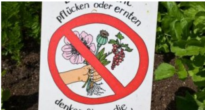
Eine Mahnung an die Pflückwilligen...

Eine große Stellwand trägt die Überschrift „Pflanzenwünsche, Menschenwünsche“ und kommt zu dem Schluss, dass beide das gleiche wollen – nämlich gesund sein. Ein glücklich lachender Apfel zum Beispiel erzählt, wie holzig und sauer er früher war – wie wenig ergiebig sein Erbgut. Dank dem Menschen sei er heute dick und süß, der Ertrag eines einzelnen Baum habe sich unglaublich gesteigert. Auch die Getreidekörner freuen sich. Früher fielen sie – kaum reif – zu Boden. Heute bleiben in den Ähren sitzen – damit der Mensch sie ernten kann. Chemie und gentechnische Veränderung ist zumindest hier kein Thema. Warum auch. Zweck dieser Informationstafeln – sowie diverser Führungen und Veranstaltungen – ist wohl, dem