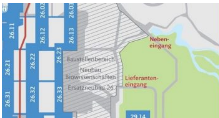
Lageplan: Botanischer Garten der HHU

Das Zentrum des Botanischen Gartens ist eine filigrane Glaskuppel aus dem Jahre 1976. Jede der 630 dreieckigen Scheiben ist gleich groß, alle Stahlrohre sind gleichlang. Die Entstehung dieser Kuppel wird im Eingangsbereich gleich auf mehreren Schautafeln ausführlich dokumentiert. In der Tat handelt es sich bei dem Wahrzeichen des Botanischen Gartens um eine Demonstration menschlicher Baukunst, die auf Euklid (300 v. Chr.) mit seinen Erkenntnissen über zusammengesetzte Dreiecke basiert. Es fallen Begriffe wie Tetraeder (3 Flächen), Oktaeder (8) und Platonische Körper.