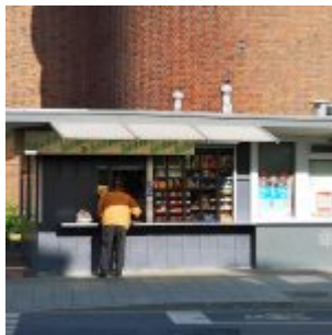
[Alle Fotos wurden aufgenommen am 14. April 2022.]