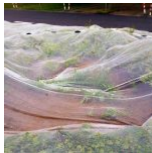
Hier standen die umgesetzten Bäume