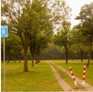
Gegenüber: Die Erweiterungsfläche