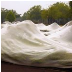
Eingepackt gegen nistende Vögel