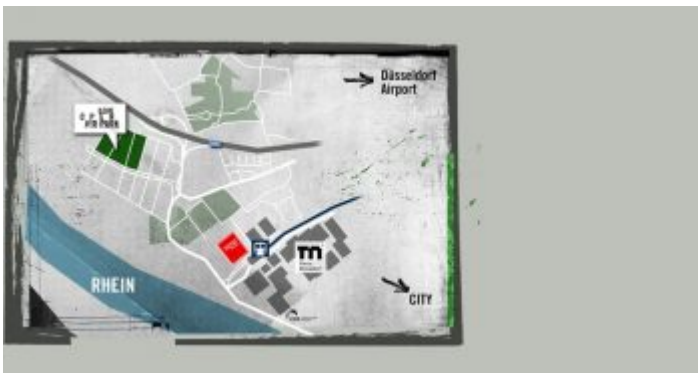
D.Live Open-Air-Park: Geländeplan