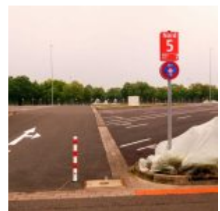
Ort des möglichen Geschehens: Feld Nord 5 des Messeparkplatzes P1