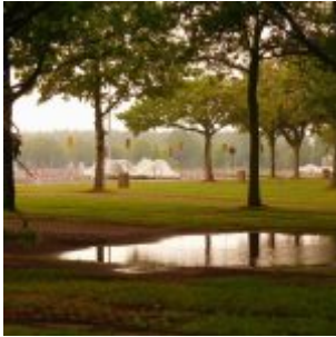
Hinter den Bäumen